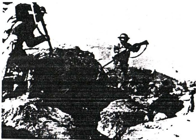
Ἀντάρται τοῦ ΕΛΑΣ συνοδεύουν τοὺς ἐμῆρους