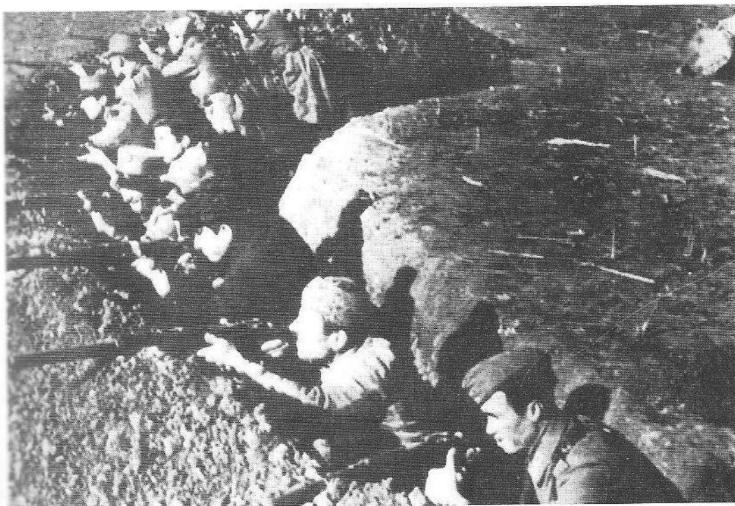
Κοινή εκπαίδευση Ελλήνων χωροφυλάκων και Ευζώνων στα περίχωρα των Αθηνών, Οκτώβριος 1943.

Αν και σύμφωνα με τον μετέπειτα υποδιοικητή τους, οι προς κατάταξη Εύζωνοι από την περιοχή της Αθήνας επιλέγονταν «αυστηρώτατα μεταξύ των πλέον Εθνικοφρόνων Ελλήνων Πολιτών συμφώνως τω πνεύματι της εκδοθείσης σχετικής εγκυκλίου» (3), αρχικά σημειώθηκε μικρή πρόοδος στη