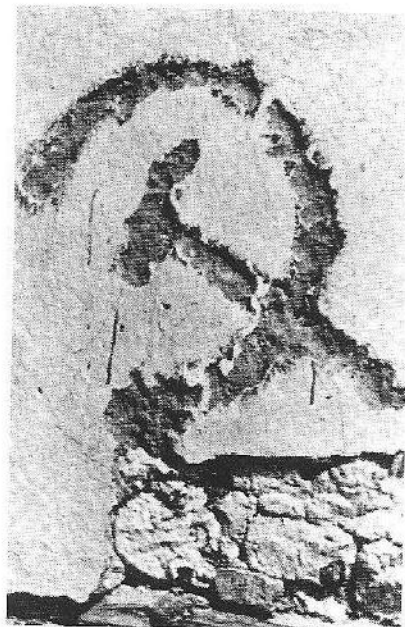
Σφυροδρέπανο χαραγμένο σε κάποιο τείχος των Αθηνών. Από την άνοιξη του 1943 ήταν φανερό πως η κυριαρχική παρουσία του ΕΑΜ και του ΚΚΕ στην πρωτεύουσα μόνο με τα όπλα μπορούσε να κατασταλεί.

Αυτή η άποψη δεν στερείται αλήθειας, καθώς το οικονομικό κίνητρο αποδείχθηκε πράγματι ελκυστικό για μεγάλη μερίδα Αθηναίων, αλλά ο Χατζής παραβλέπει να ασχοληθεί με τους «ιδεολόγους», δηλαδή όσους στρατεύτη-