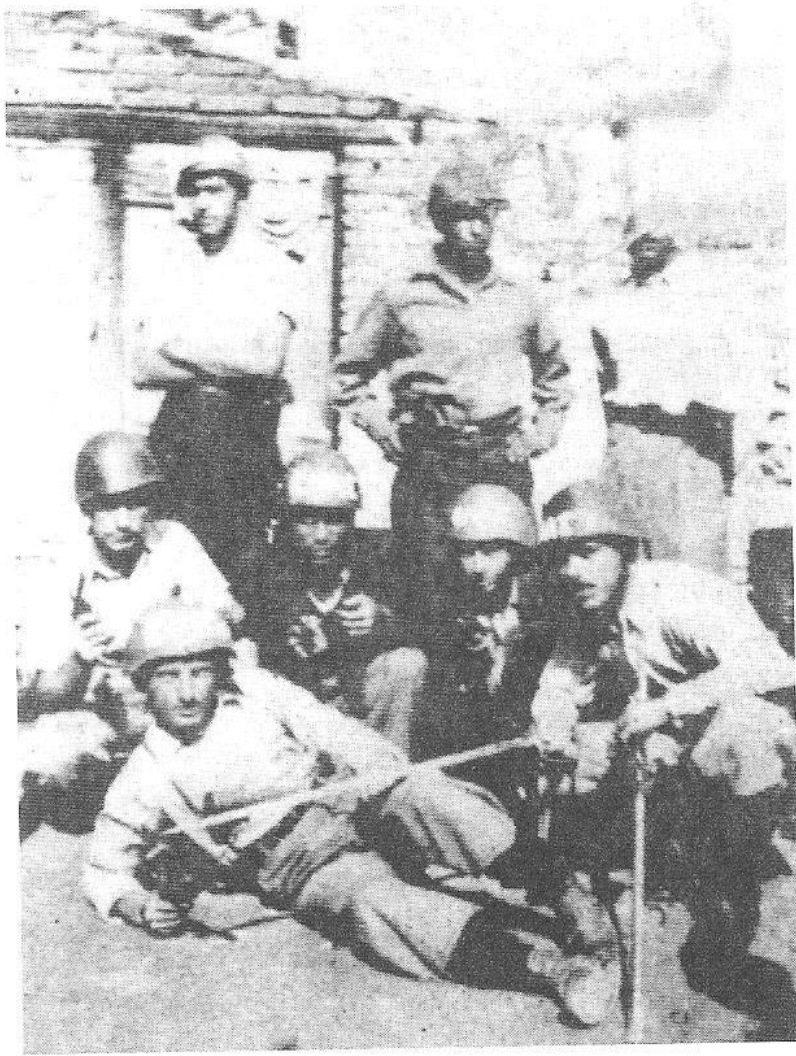
Μαχητές του ΕΛΑΣ Κοκκινιάς με ελληνικά και ιταλικά κράνη το 1944.

φανερό πως δεν μπορούσαν να ασκήσουν τον παραμικρό έλεγχο πέρα από την προσωρινή κατάληψη μιας μικρής αστικής περιοχής.