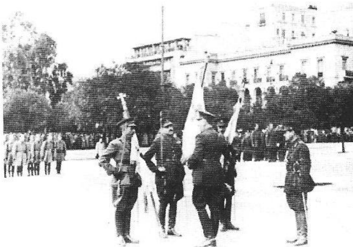
Στις 12 Μαρτίου 1944, το Τάγμα Φρουράς Αγνώστου Στρατιώτη έλαβε μέρος στον εορτασμό της γερμανικής «Ημέρας των Ηρώων» που πραγματοποιήθηκε στο μνημείο του Αγνώστου Στρατιώτη.

ήταν πρώην οργανωμένος στον ΕΛΑΣ και υποδείκνυε όλους τους παλιούς συντρόφους του. Όταν μια ομάδα του ΕΛΑΣ επιχείρησε να σπάσει τον κλοιό και τραυμάτισε μερικούς Ευζώνους και έναν Γερμανό λοχαγό, οι Γερμανοί εκτέλεσαν περισσότερα άτομα «εκτός καταλόγου», ανεβάζοντας τον αριθμό των θυμάτων σε 104 νεκρούς και 3.000 συλληφθέντες που κατέληξαν στα γερμανικά στρατόπεδα. Το μίσος εναντίον των Ταγμάτων ξεχειλίζει, το ίδιο και ο φανατισμός των ανδρών του, οι οποίοι στην καταστροφή