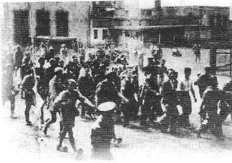
Τσολιάδες οδηγούν αιχμαλώτους στην εκτόπιση μετά από κάποιο μπλόκο σε συνοικία των Αθηνών.