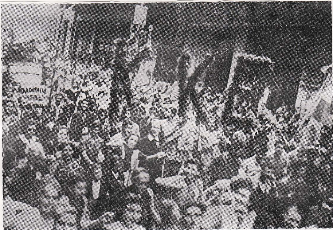
Μία από τας γνωστάς εις τούς παλαιότερους, καθοδηγούμενας διαδηλώσεις του ΚΚΕ, εϋ- θύς μετά την απελευθέρωσιν. Σφιγμένες γροθιές, μίσος, κραυγές «θάνατος - θάνατος», «λαοκρατία». Ωργανωμένη προσπάθεια προκλήσεως, θάσει σχεδίου, τὸ ὁποῖον, ὡς ὁμολο- γεῖται εἰς τὸ δημοσιευόμενον ἄγνωστον κείμενόν των, εἶχεν ἐτοιμασθῆ ἀπὸ τούς κομμου- νιστάς ἀπὸ τοῦ θέρους τοῦ 1944, ἀσχέτως ἂν τώρα οἱ κομμουνισταὶ ἰσχυρίζονται ὅτι «τὰ Δεκεμβριανὰ τὰ ἐπέβαλαν ἄλλοι στοὺς κομμουνιστάς» καὶ ὅτι οἱ ἴδιοι δὲν ἦσαν προετοι- μασμένοι διὰ τὴν σύγκρουσιν

Ὁ ἰσχυρισμὸς σας ὅτι προϋπαγεύεται τὴν Κυβέρνηση καὶ τὴν τάξην ἀποτελεῖ ὁμολογίαν ὅτι ὑπερασπίζεται μίαν φασιστικὴν δικτατορίαν τῆς ἐλαχιστοτάτης ἐκείνης μερίδος πού ἐνιέερασε στὸν Ἐθνικοαπελευθερωτικὸν ἀγῶνα καὶ συνεργάσθηκε ἀνοιχτὰ μὲ τούς κατακτητῆς ἐναντίον τῆς πατριδος τῆς καὶ τοῦ συμμαχικοῦ ἀγῶνος