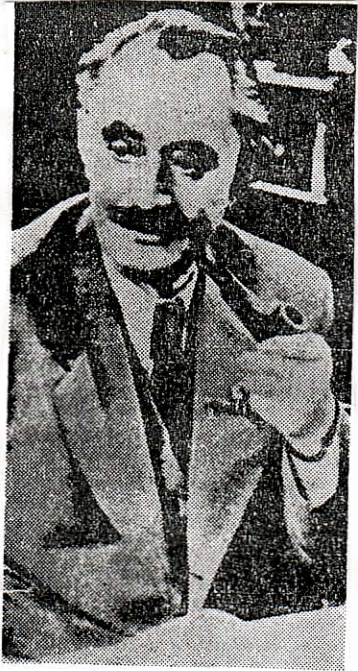
Ο Δημητρώφ κατά φωτογραφίαν τής έποχής. Έπαγίδευσε και έξώθησε τήν άφελή ήγεσίαν του ΚΚΕ εις τό κίνημα, διά νά ώφεληθι ή Βουλγαρία.

πτικοινωνία (μέ άσύρματο, συν δέσμους κ.ά.) μέ τό σοβιετικό Κ.Κ., άλλα μέ τό Κ.Κ. Βουλγαρίας και προσωπικά μέ τον Δημητρώφ... Αυτός ειδοποίησε τον Σιάντο, μεσούντος του κινήματος, νά μήν περιμένη διεθνή κομμουνιστική συμπαράστασι και αυτός έξώθησε τό Κ.Κ.Ε. στην άνάληψι ένόπλιου δράσεως, άρχικώς. Τί άκριβώς συνέβη;