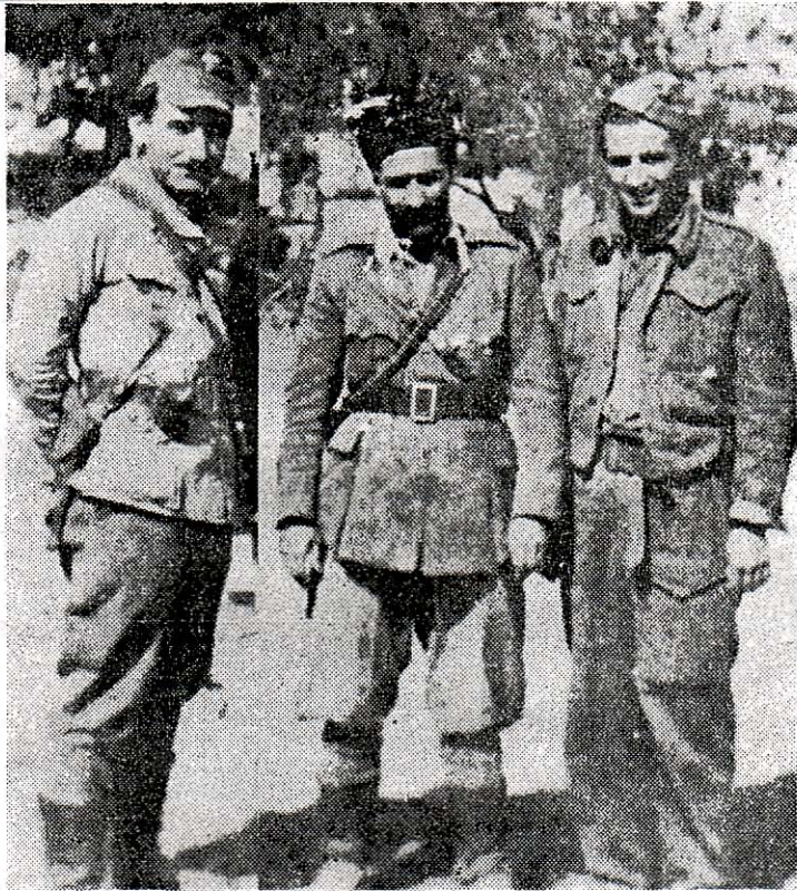
Ο Όρεσθης — Ανδρέας Μούντριχας — εις τό μέσον, ο όποιος προεκάλεσεν ούσιαστικώς την άποτυχία του ΚΚΕ. Άριστερά, ο καπετάν Διαμαντής και δεξιά, ο καπετάν Γιώτης, ο σημερινός αρχηγός του ΚΚΕ, Χαρίλαος Φλωράκης, όλίγον πρό τής επιθέσεως κατά των Αθηνών.

από τ' άπάνω. Τό λάθος είναι ότι διατάχθηκε η όμηρία χωρίς πειθαρχία και σχέδιο και εκφυλίστηκε σε εξωπολιτική πράξη». Αργότερα, στο 7ο συνέδριο του ΚΚΕ, 11-6 Οκτωβρίου 1945), ο γραμματέας της «Κομμουνιστικής Οργάνωσης Αθήνας» — ΚΟΑ, ο Μπαρτζώτας, είπε τα εξής: «Έχουμε άκομα τό Δεκέμβρη και τις υπερβάσεις του. Μέσα στό λάθος που έγιναν τό Δεκέμβρη, έχουμε και πολλά που άφορούν τ.ν ΚΟΑ. Τό Δεκέμβρη και σε πολλές περιπτώσεις, μας έφυγε ή κατάσταση από τα χέρια μας».