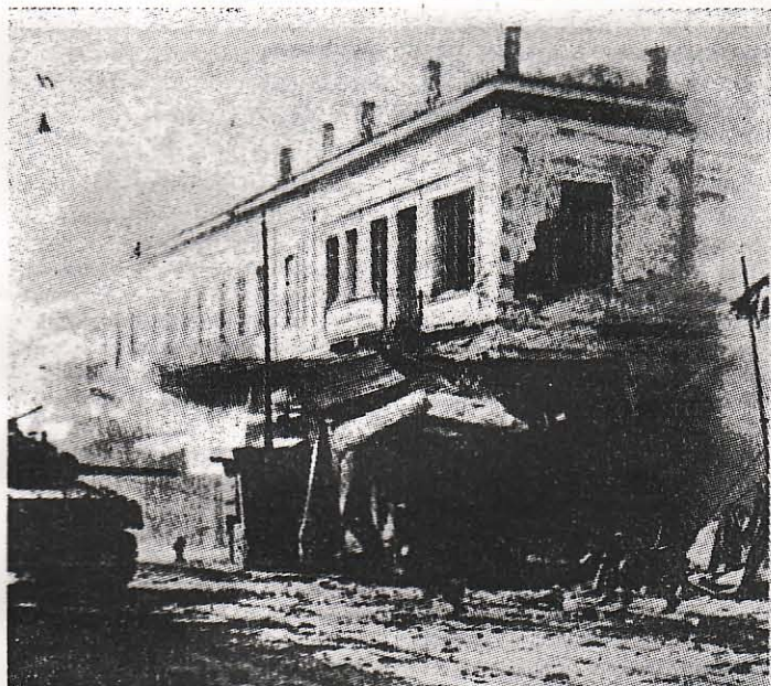
Ἀνατίναξις κτιρίου διὰ τὴν κατασκευὴν οδοφραγματῶν ὑπὸ τῶν κομμουνιστῶν. Ἀριστερά, διακρίνεται ἓνα θρεταννικὸν τάνκ, τὸ ὁποῖον ἔσπυεσε διὰ τὰ ἀπομακρύνει τοὺς Ἑλασίτας

14.— Συνεχίζονται οἱ ἐπιθέσεις τοῦ ΕΛΑΣ. Στὴν Πλατεία Βάθης καταλαμβάνουν ἀγγλικὸ γκαράζ. Μὲ 8 μοτοσυκλέτες καὶ 3 αὐτοκίνητα ὄλα καινούργια. Στὸν Πειραιᾶ γιὰ πρώτη φορὰ παρουσιάζεται σοβαρὴ δρᾶσις τῶν Ἀγγλων. Ἀγγλοὶ μὲ τάγκς ἐπιτίθενται στὴν ἐδὸ Πινδάρου — Τζαβέλλα(;) μὲ ἀποτέλεσμα νὰ καταλάβουν ἓνα οδοφραγμα ὕστερα ἀπὸ ἥρωικὴ ἀντίστασις τοῦ ΕΛΑΣ μὲ συνδρομὴ τοῦ Λαοῦ. Ἀεροπλᾶνα πυροβολοῦσαν σφοδρὰ ὄλη τὴν ἡμέρα.