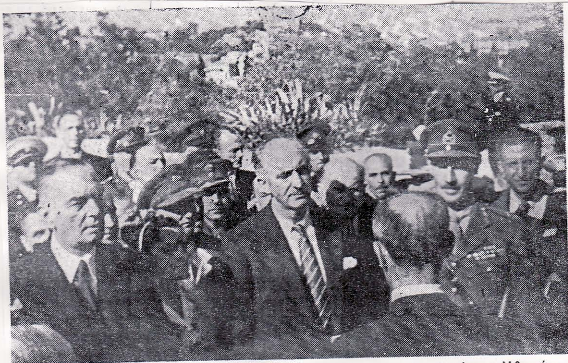
Ο τότε πρωθυπουργός Γ. Παπανδρέου, ακούει προσφώνησιν του δημάρχου 'Αθηναίων Σκληρού, εις την τελετήν που ώργανώθη εις την 'Ακρόπολιν εϋθύς μετά την άφιξιν της κυβερνήσεως εις την άπελευθερωθείσαν πρωτεύουσαν. Δεξιά, έν στολή, διακρίνεται ο στρατηγός Σκόμπυ. Ολίγον άργότερον, αί διαταγαί του Γ. Παπανδρέου θά σχίζωνται από τους έρυθρούς και ο Σκόμπυ θά «κρηυχθή» έχθρός

Μερικοί Χωροφύλακες ένισχυθέντες και από ναύτες που βγάλαν από τὰ πολεμικά κλείστηκαν στο μέγαρο Βάτη. Οι Άγγλοι εκεί δεν πήραν κανένα μέρος αλλά ύστερα από την πλήρη επικράτηση του ΕΛΑΣ έδωσαν πυκνές περιπόλους.