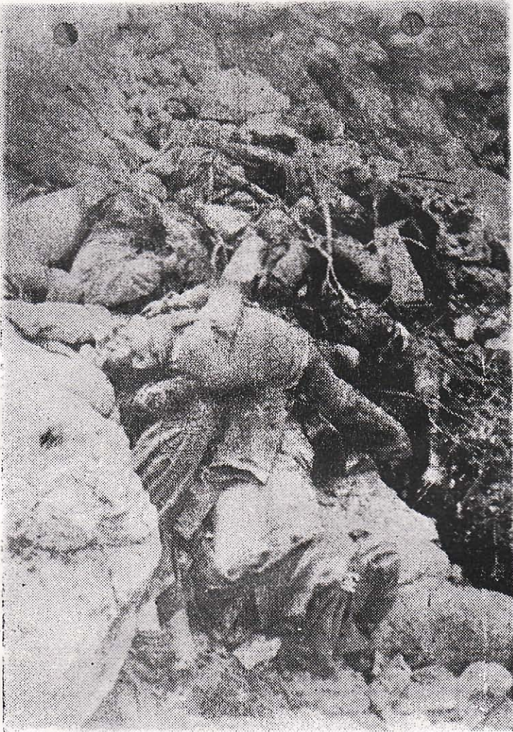
Άθωα θύματα της κομμουνιστικής θηριωδίας, γεμίζουν τά πηγάδια και τά χαντάκια στα Τουρκοβούνια, στο Περιστερι, στην Ούλεν. Άλλ' η ήττα των δολοφονικών όρδών του ΕΛΑΣ δεν είναι μακριά