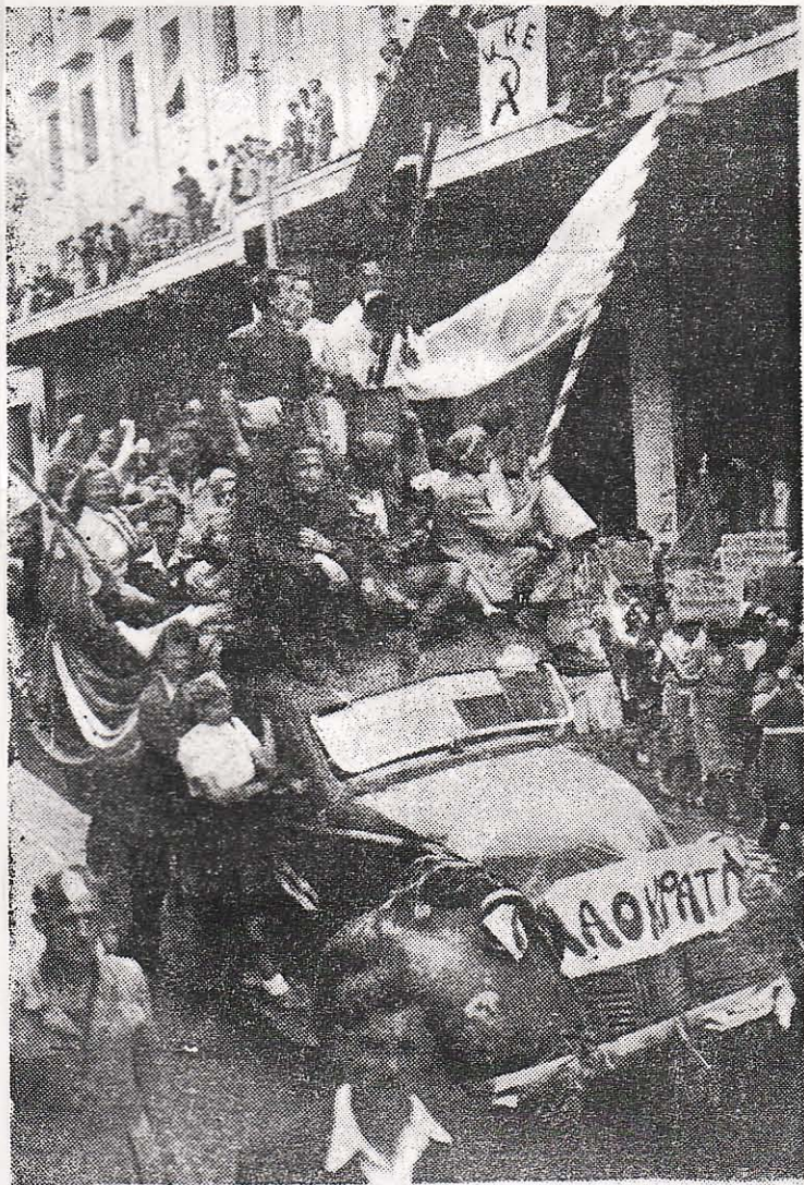
Διαδήλωσης των Έσμιτων - Έλασιτών, μετά την απελευθέρωση των Αθηνών από τις δυνάμεις κατοχής. Το όργανο των σφαγίων, θα εξασπλυθη όλιγον αργότερον και άφοβ «κατασκευασθούν» κάποια προσχήματα