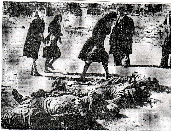
Στὶς συνοικίες πού ἐγκατέλειπαν οἱ Ἑλασίτες οἱ Ἀθηναῖοι ἀνακάλυπταν ἄταφα καὶ κατακρεουργημένα τὰ πτώματα τῶν συγγενῶν τους, πού εἶχαν πέσει θύματα τῆς κομμουνιστικῆς θηριωδίας

Στὸν Πειραιᾶ σήμερα ἐκδηλώνεται νέα ἐπίθεσις στὴν περιοχὴ Ταμπούρια — Δραπετσῶνα, μετὰ ἰδιαίτερη σφοδρότητα στὸ Νεκροταφεῖο Ἀναστάσεως καὶ στὸν συνοικισμό Εὐγενίας, ὅπου ἡ ἐξόρμησι τοῦ ἐχθροῦ ἐκδηλώνεται ἀπὸ Ν. καὶ Β. μετὰ ἀρκετὸ ἀριθμὸ μηχανοκινήτων. Τὰ τμήματα τοῦ ΕΛΑΣ μπρὸς στὴ σφοδρὴ ἐπίθεσι τοῦ ἐχθροῦ μ' ὅλα τὰ μέσα συμπύχθησαν μετὰ τὴν ὑποστήριξιν τοῦ πυροβολικοῦ. Τῆς ἀπογευματινῆς ὥρας ὁ ἐχθρὸς συνεχίζει τῆς ἐπιθέσεις του. Τὴν νύκτα, ὥρα 21, τὰ τμήματα τοῦ ΕΛΑΣ ἐνεργοῦν ἀντεπίθεσι καὶ ἀνακαταλαμβάνουν τῆς πρώτης κατοικίας τοῦ συνοικισμού Εὐγενίας. Νέα προσπάθεια τοῦ ἐχθροῦ νὰ ξαναπροχωρήσῃ ἀποκρούεται. Στὸν ὄρομ Ἁγίου Γεωργίου συνεχίζονται ἀποβάσεις Ἀγγλῶν πεζικοῦ καὶ Τάγκς. Γιὰ