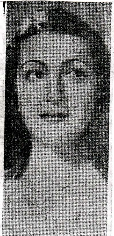
Ή άγρίως δολοφονηθείσα κορυφαία ήθοποιός Έλένη Παπαδάκη. «Τέτοιες περιπτώσεις ήταν σφάλματα», είπε ο Ζαχαριάδης, όταν έγινε άπολογισμός του ένγκληματικού όργιου του ΚΚΕ.

Τά άνατριχιαστικά «χωνιά» του ΕΑΜ — ΕΛΑΣ, άρχισαν από το βράδυ να ρίχνουν τα έμπρηστικά τους συνθήματα, με ταυτόχρονης άπειλής: «ΕΡΧΕΤΑΙ Ο ΟΡΕΣΤΗΣ» (δηλαδή, ή πανίσχυρη 11 Μεραρχία του ΕΛΑΣ, που είχε καπετάνιο, ουσιαστικό άρχηγό και έμπιστο του Σιάντου, τον καπεταν Όρέστη, Άνδρέα Μούντριχα). Και το πρωί της έπομένης, είχε κατακοκκινίσει ή πόλις των Άθηνών, με τις ίδιες τοιχογραφίες: «ΕΡΧΕΤΑΙ Ο ΟΡΕΣΤΗΣ». Ο λαός