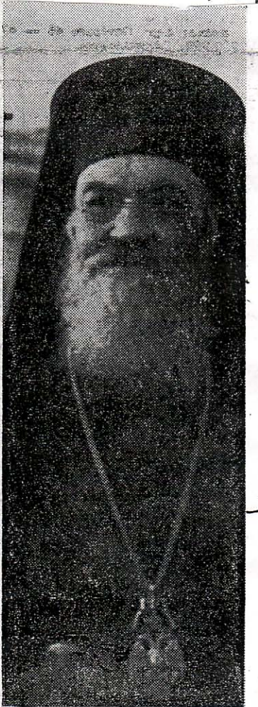
Ὁ τότε Ἀρχιεπίσκοπος καί Ἀντιβασιλεὺς Δαμασκηνός.

Κανελλόπουλος: Μή γελάς, Παρτσαλίδη. Εἶσαι ἀρκέτα εὐ- φυής δια νά γνωρίζης ὅτι εἶ- σαι φασίστας καί εἰμαι ἀρκε- τα τίμιος δια νά εἰμαι δημο- κρατικός. Ὁ καθένας ἀπορεῖ, πῶς καί διατί ὠχυρώσατε τό- σα κτίρια ἐντός των Ἀθηνῶν, ἐνώ κατά τό διάστημα τῆς κα- τοχῆς δέν ἦτο οὔτε ἓνα μονα-