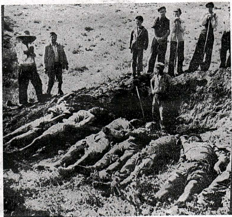
Πτώματα, πτώματα παντοῦ γύρω ἀπὸ τὴν πρωτεύουσα. Οἱ αἱμοσταγεῖς Ἐλασίτες, κατέσφαξαν χιλιάδας ἀθῶων κα- τὰ τὸ Δεκεμβριανὸν τῶν ἐγκληματικῶν ὄργιων.