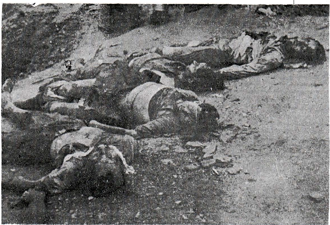
Θύματα τῆς κομμουνιστικῆς θηριωδίας στὸ Περιστέρι. «Ἦσαν φρικτὰ κακοποιημένα καὶ ἀκρωτηριασμένα τὰ θύματα», εἶπε ὁ Σιτρίν, ὅταν ἀρχίσαν νὰ ἀνακαλύπτονται οἱ ὁμαδικοὶ τάφοι τῶν δολοφόνων

γελόπουλος (ὑπουργὸς καὶ ὑφυπουργὸς τῶν Οἰκονομικῶν) ἐκ μέρους τῆς ΠΕΕΑ. Ὁ Ἥλιος Τσιριμώκος, ὡς ὑπουργὸς Ἐθνικῆς Οἰκονομίας, ὁ Ν. Ἀσκούτσης, ὡς ὑπουργὸς Δημοσίων Ἔργων καὶ ὁ στρατηγὸς Σαρηγιάννης, ὡς ὑφυπουργὸς Στρατιωτικῶν, ἐκ μέρους τοῦ ΕΑΜ. Στὴν ἴδια κυβέρνησι συμμετείχαν ὁ Π. Κανελλόπουλος (ὑπουργὸς Ναυτικῶν), ὁ Θ. Τσάτσος Ἐφοδιασμοῦ, ὁ Γ. Καρτάλης ἄνευ Χαρτοφυλακίου, ὁ Π. Γαρουφαλιάς ἐπὶ τοῦ Τύπου καὶ ὁ Στ. Στεφανόπουλος ἐπὶ τῶν Μεταφορῶν. Περί τὰ τέλη Ὀκτωβρίου ἐφθάσε στὰς Ἀθήνας καὶ ἡ Ὀρεινὴ Ταξιαρχία - Ρίμινι, ὑπὸ τὸν Θρ. Τσακαλώτο.