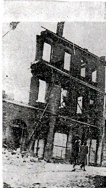
Οί κομμουνιστάι άφψαν χιλιάδας οικογενειάρχας στόν δρόμο με τες συνεχείς ανατινάξεις οπιτιών. Στην φωτογραφία μας μία εικόνα τής τότε Αθίνας πού οί παλιότεροι θα την ένθυμούνται με φρίκη.

λία πού είχε με τόν Σιάντο στη Χασιά, έζήτησε να συλληφθή ο Ορέστης, να δικασθή συνοπτικά και να έκτελεσθή, ως κυριος και μοναδικός ύπεύθυνος, για την ήττα. Ο Σιάντος συμφώνησε. Άλλά την άλλη ήμερα είπε στον Ιωαννίδη (όπως αναφέρεται στα όσα έδημοσίευσε ή «Αύγή» — Ιούλιος, Αύγουστος 1976), ότι ο Ορέστης... άρνείται να πάη στη Χασιά! Δηλαδή, ο Σιάντος δεν είχε την δυναμι ή δεν ήθελε να τόν συλλάβη; Στο σημείο αυτό δημιουργείται σε πολλούς ή ύποψία, ότι ο Σιάντος, όταν εύρέθη πρós τών πυλών, έσύρθη από τόν Ορέστη ή ήνέχθη τες σκόπιμες παραλείψεις του. Άργότερα τό ΚΚΕ κατήγγειλε τόν Σιάντο ως πράκτορα τής Ίντέ-