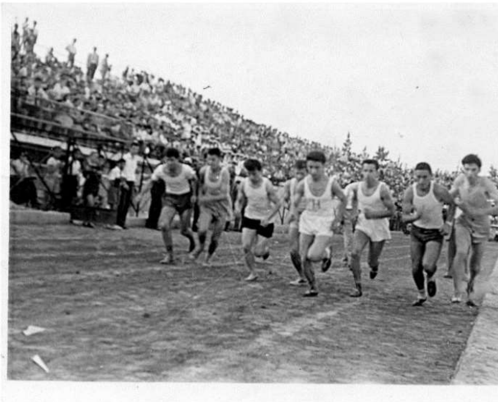
Η εκκίνηση της κούρσας των 800μέτρων στους Σχολικούς Αγώνες Β' Περιφέρειας Αθηνών, στο κατάμεστο Γήπεδο της Νέας Φιλαδέλφειας (ΑΕΚ), στις 18 Μαΐου 1958. Διακρίνομαι πρώτος δεξιά, στην Εσωτερική Γραμμή (Β' Γυμνάσιο Αρρένων Αθηνών). Ο τέταρτος στα αριστερά (δυστυχώς δεν ζει